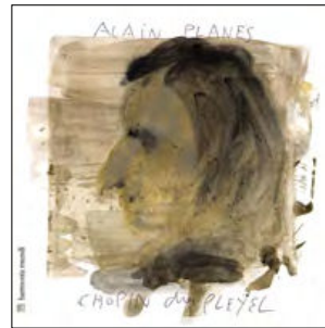
Chopin chez Pleyel A journey into Chopin's world CD HMC 902052