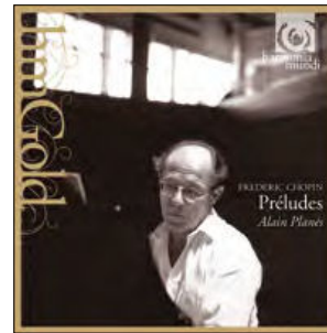
Preludes Mazurkas op.41, Nocturne, Barcarolle... CD HMG 501721