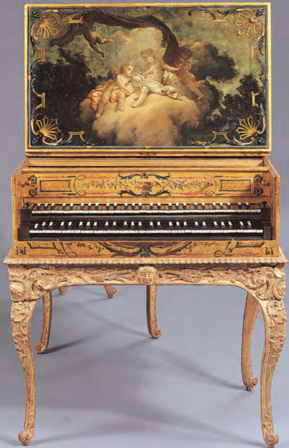
Harpsichord by Joannes Couchet (ca. 1645), ravaled by François-Étienne Blanchet (ca. 1720), from the collection of the Musée instrumental de Provins