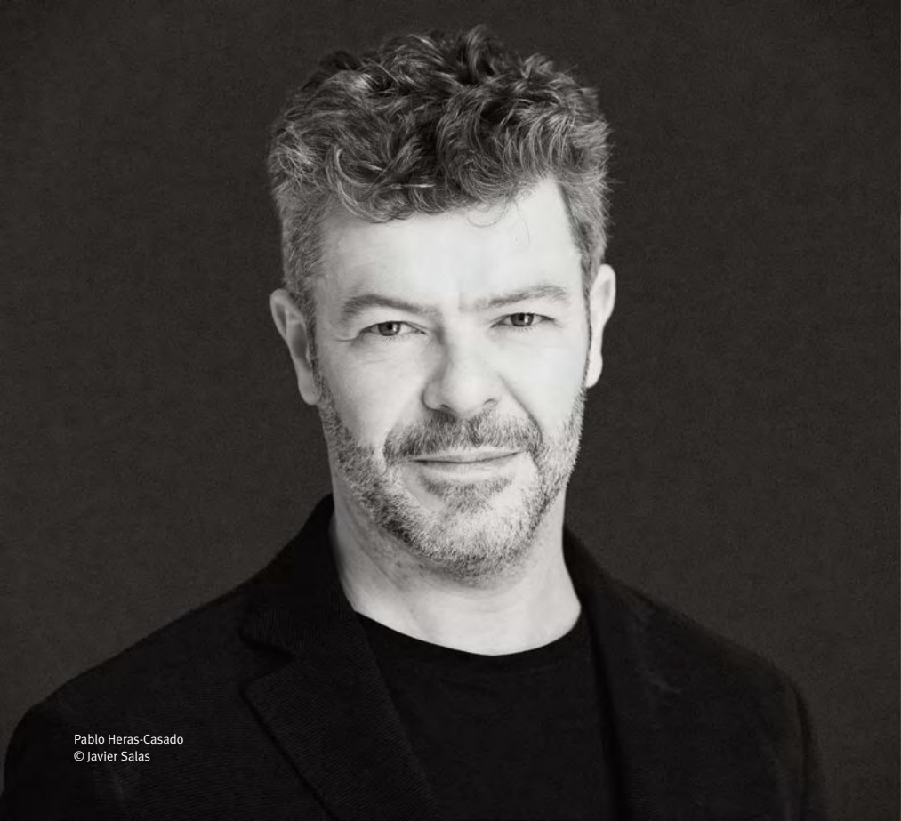
Pablo Heras-Casado © Javier Salas