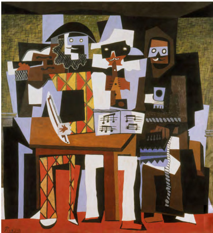
Pablo Picasso, Trois musiciens , 1921, huile sur toile Philadelphia Museum of Art, Pennsylvania, PA, USA / © Succession Picasso/DACS, London 2023 / Bridgeman Images A. E. Gallatin Collection, 1952