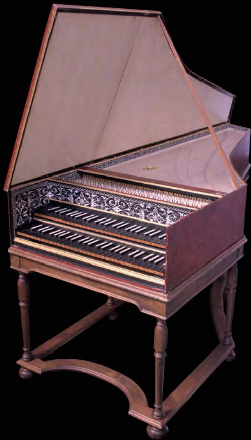
Clavecin franco-flamand de William F. Morton (Paris, 1991) d'après le clavecin de Iohannes Ruckers de 1624 (Musée Unterlinden de Colmar collection François Ryelandt, Bruxelles).